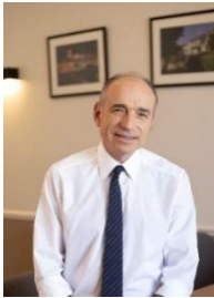
Jean-François COPE, ancien Ministre, Maire de Meaux, Président délégué de la Fondation Prospective & Innovation

Jean-François Copé est Maire de la ville de Meaux et avocat en droit des affaires au barreau de Paris. Il est marié et a quatre enfants. Il est diplômé de Sciences Po et de l'ENA puis entame sa carrière de haut fonctionnaire au sein de la Caisse des Dépôts et Consignations jusqu'en 1993.